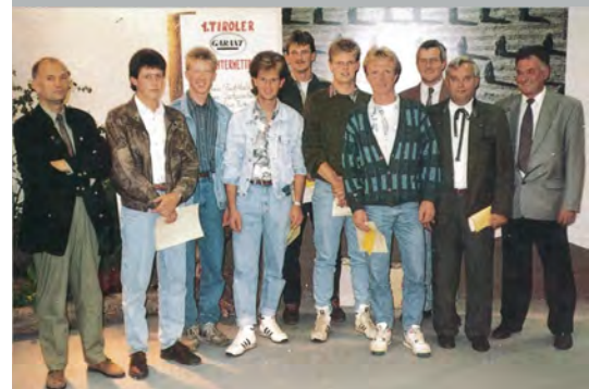
Der 1. Tiroler Garant Jungzüchterwettbewerb war 1992 der Startschuss für die Jungzüchterbewegung in Tirol.

Durch die Vielzahl der angebotenen Dienstleistungen können mehrere Programme mit nur einem Betriebsbesuch durchgeführt werden. Das spart den LandwirtInnen Zeit und Geld.