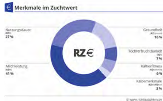
Gewichtung der Merkmale im RZ€

Neue Auswertung aktuelle Melkbarkeit: zeigt die vorhandenen Melkbarkeiten der aktuellen Kühe am