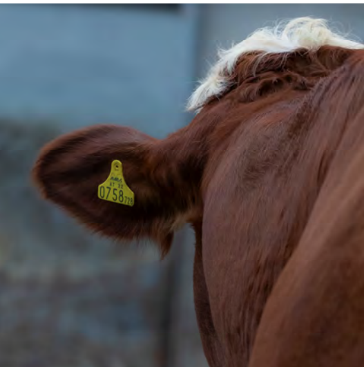
Die elektronische Ohrmarke für Rinder ist auf dem linken Ohr in Blickrichtung des Rindes anzubringen.