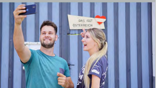
Zahlreiche Landjugendliche haben dieses Wochenende die „Das isst Österreich“ Hoftafeln gebaut.

duktion durch billige Importlebensmittel“ verhindern. Mit der verpflichtenden Herkunftskennzeichnung auf dem Teller gibt man den heimischen KonsumentInnen und ProduzentInnen eine faire Chance in der Auswahl der Lebensmittel und der Entscheidung über die Entwicklung der zukünftigen Versorgungssicherheit. „Zudem sollten wir nicht vergessen, dass die heimischen Bäuerinnen und Bauern nicht nur hochwertige Lebensmittel produzieren, sondern auch mit ihrer Bewirtschaftung die Kulturlandschaft und unsere Lebensräume für die Gesellschaft und den Tourismus erhalten und pflegen“, so Lederhilger.